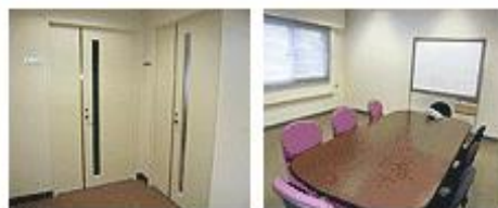
カスタマースペース

システム導入当初のシステム構築や検証作業時には、データセンターに併設された検証室をご利用いただき、システム導入作業の効率化をサポートします。 また、お客様のシステム保守・運用スペースとしてもご利用いただけます。